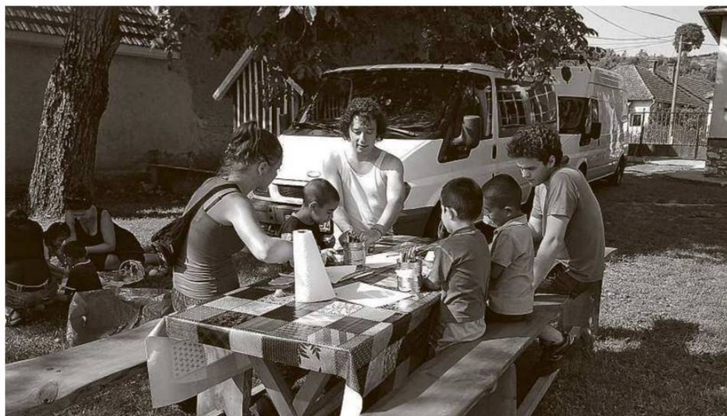
Foglalkozás az idei táborban