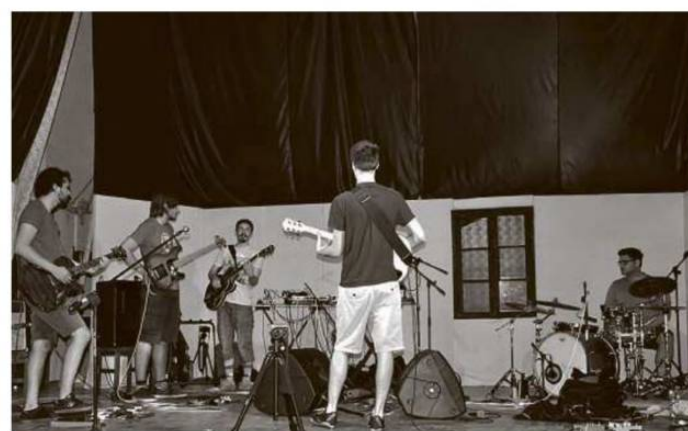
Munkában a zenészek